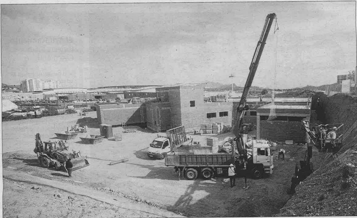
Las obras de la clínica se están llevando a cabo en una parcela que hay frente al centro comercial Nueva Condomina. ISRAEL SÁNCHEZ